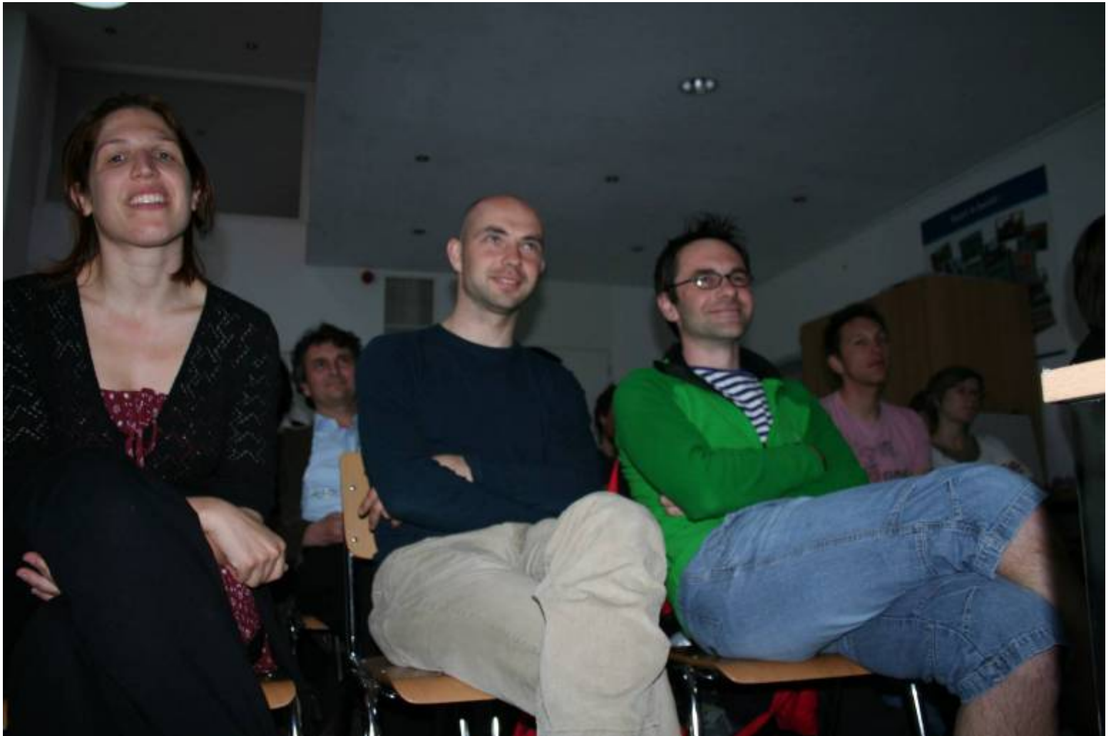
Een enthousiast publiek